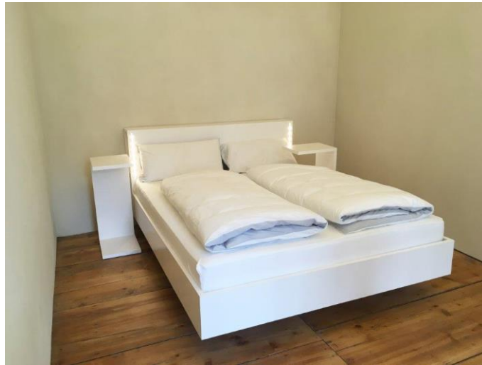
Wingburg-Schloss-Wiehe-03-8: Das nahezu schwebende Bett betont die Leichtigkeit des Raumes.