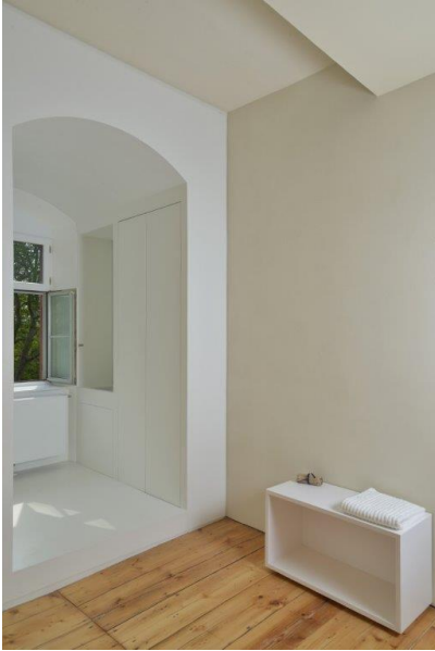
Wingburg-Schloss-Wiehe-8571: Die zusätzliche Wand bildet einen Zwischenraum. Der weiße schlichte Alkoven betont die reduzierte Raumgestaltung.