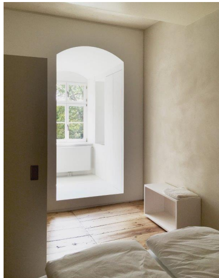
Wingburg-Schloss-Wiehe-03-1: Die einzelnen Elemente in Weiß und Champagnerfarben ergeben ein stimmiges Gesamtbild.