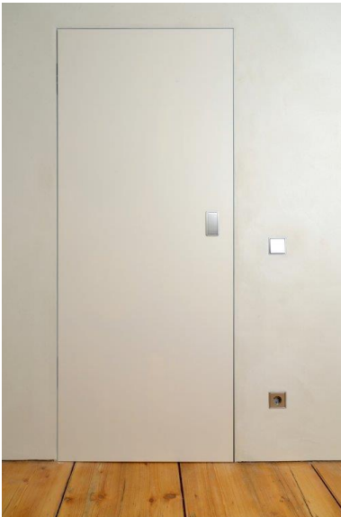
Wingburg-Schloss-Wiehe-8568: Die flächenbündige Tür fügt sich optimal in das reduzierte Design des Musterzimmers.