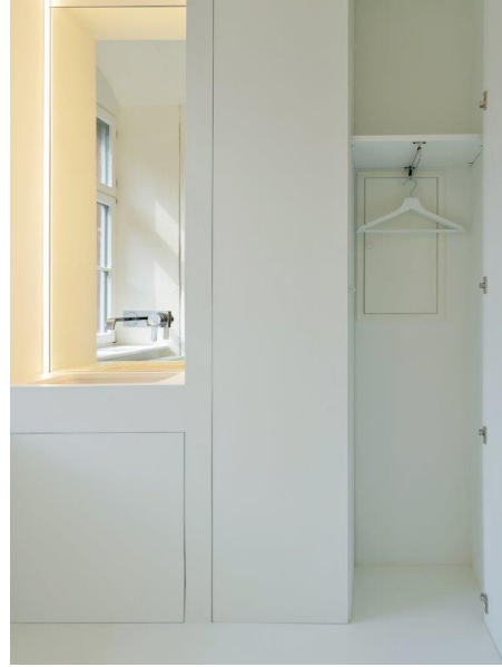
Wingburg-Schloss-Wiehe-8599: Die Nische bietet Platz für ein Bad und einen Kleiderschrank und minimiert so die Eingriffe in den Raum.