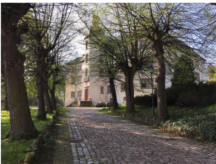
Wingburg-Schloss-Wiehe-Außenaufnahme: Das Schloss aus dem 17. Jahrhundert dient künftig als Tagungs- und Exkursionsort.