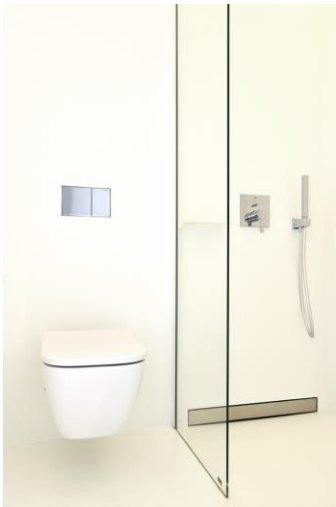
Wingburg-Schloss-Wiehe-8597: Das moderne Bad befindet sich ebenfalls in der Fensternische.