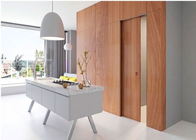
Wingburg_Belport.jpg: Mit seinen Schiebetürsystemen hat der Hersteller den Stand der Technik von Innentürsystemen neu definiert. Die Ausführung Belport überzeugt mit einer zargenlosen Optik.